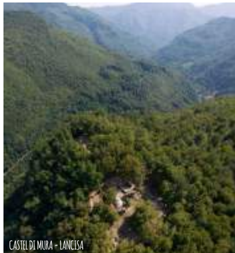
CASTEL DI MURA - LANCISA