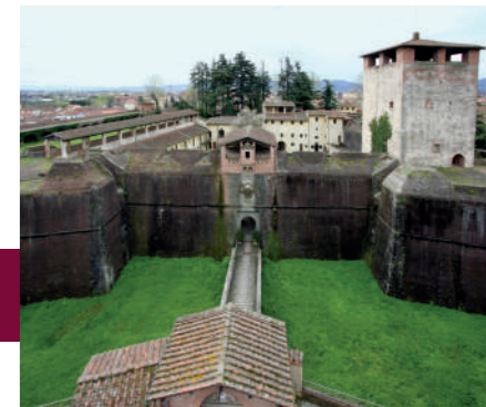
La Fortaleza de Santa Bárbara

El monumento, en estilo gótico conventual de Pistoia, presenta un elegante claustro renacentista.