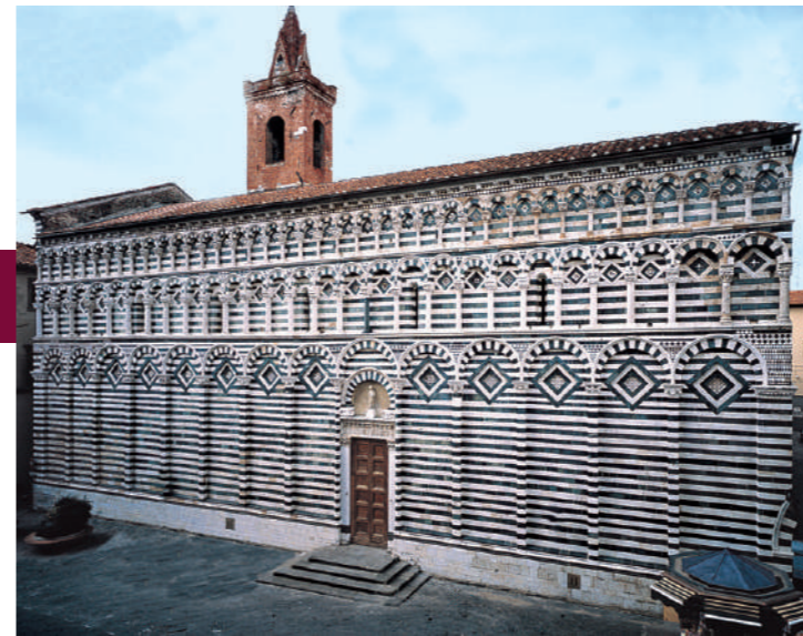
Iglesia de San Juan Fuorcivitas

La iglesia se remonta al siglo VIII. Se puede admirar la fachada actual, de 1263. Actualmente, en el monasterio adyacente funciona el Liceo Artístico.