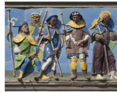
Acogida de los peregrinos, baldosa que decora el pórtico del Hospital del Ceppo

El convento, surgido a mediados del siglo XIII, perteneció a los frailes de los Hermanos Hospitalarios de la Orden de