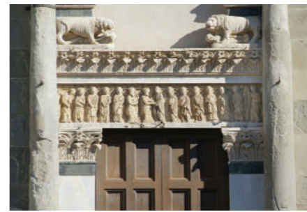
Iglesia de San Bartolomé en Pantano

Tiene su origen en la ampliación, a mediados del siglo XIV, de una iglesia más antigua y presenta caracteres del románico y del gótico. El portal en forma de cúspide presenta en la luneta una estatua de San Pablo y en la cúspide superior una estatuilla de San Jacobo.