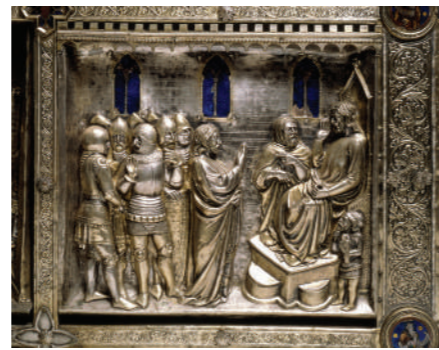
Detalle del altar de plata de San Jacobo presente en la Catedral