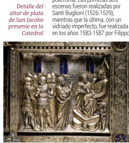
Detalle del altar de plata de San Jacobo presente en la Catedral