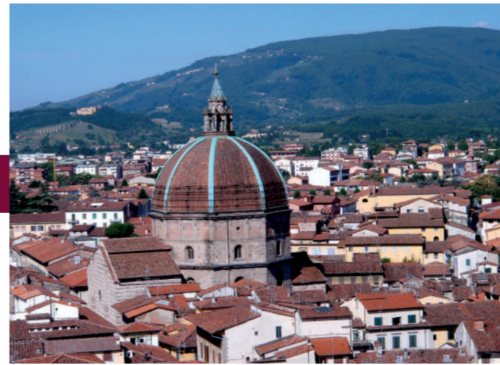
La majestuosa cúpula de la Basílica de la Virgen de la Humildad

La iglesia se remonta al siglo VIII. Se puede admirar la fachada actual, de 1263. Actualmente, en el monasterio adyacente funciona el Liceo Artístico.