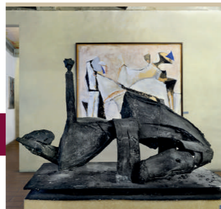
Interior del Museo Marino Marini y, al lado, el Púlpito de Giovanni Pisanò en la Iglesia de San Andrés